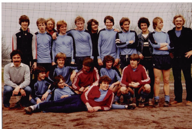
Die A-Jugend von 1982, viele bekannte Gesichter, die man heute noch ständig auf dem Fußballplatz antrifft: