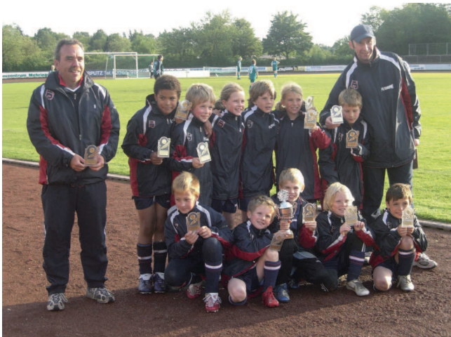
F-I-Junioren vom STV Hünxe holen das Double in 2006/07

Als wir in der Spielzeit 2006/07 bereits mit 12 Mannschaften am Geschehen im Kreis 9 mitmischten, reifte eine neue Generation von talentierten Kickern heran. Wieder einmal konnte eine F-Jugend Meister und Pokalsieger werden.