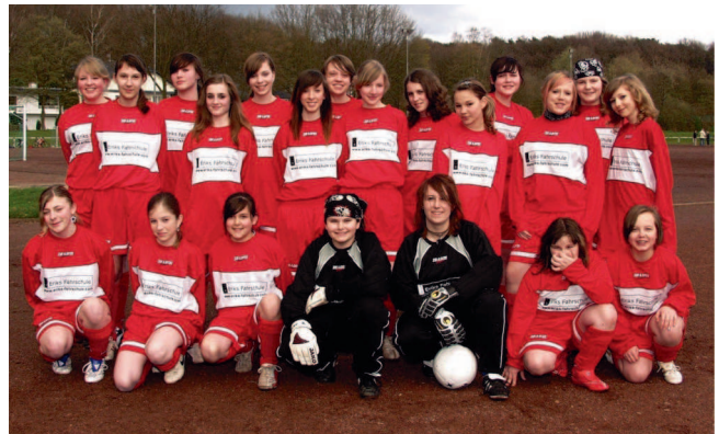
Hünxes erste Mädchenmannschaften, die an einer Meisterschaft teilnahmen (7er, U17 und U15)