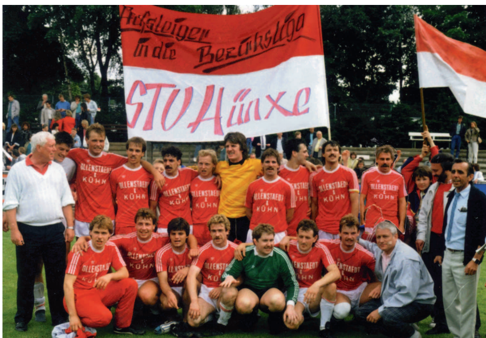
Die Bezirksligaaufsteiger 1988

Durch eine 2:4 Niederlage im entscheidenden Spiel gegen Viktoria Buchholz verpasst die 1. Mannschaft nur knapp den Aufstieg in die Landesliga.