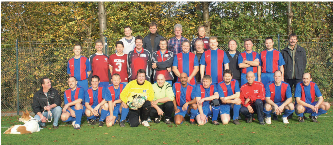
Alte Herren 2011/2012